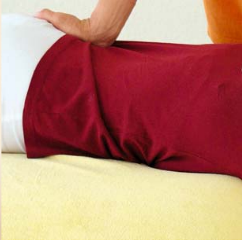
Dieser Griff dehnt die Körperrückseite.

Für Menschen, die von ihrem Naturell her eher ruhig sind und ihre Tatkraft aktivieren wollen, ist die sogenannte „Holzhackerübung“ geeignet. Dafür stellt sich der Betreffende auf die Zehenspitzen und vollzieht eine ähnliche Körperbewegung